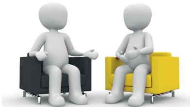
Stand: Januar 2024